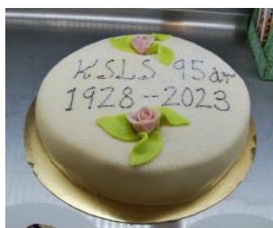
28 augusti.