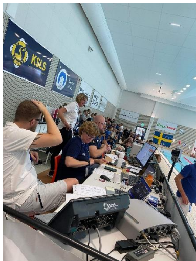
Sum Sim Region.