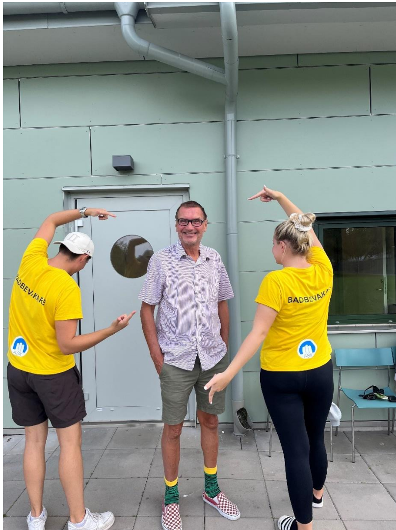
Badbevakning på Gamlegårdsbadet i samverkan med ABK.