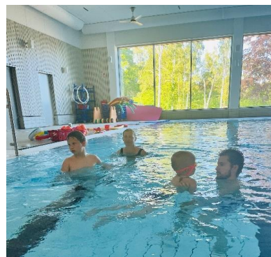
Sista tillfället 2023.