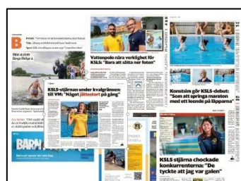
Del av mediaklipp 2023.