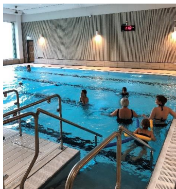
Glädje och gemenskap.

Verksamheten möjliggjorts tack vare Kristianstad kommun, Sparbanken Skåne, Mio, M Malmsten AB och Grant Thornton men framför allt genom alla enskilda personer som ställt upp ideellt, inklusive skänkt simkläder och handdukar.