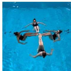
KSLS uppvisning