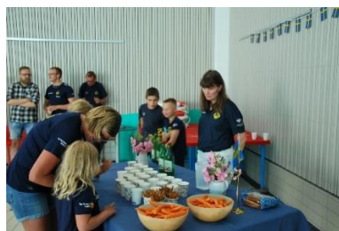
Hyllningsevent juli 2023.