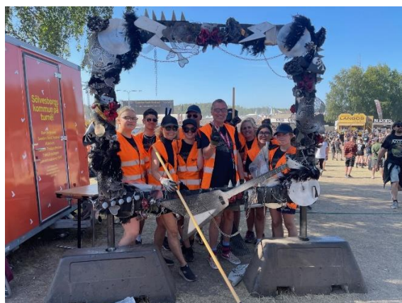
KSLS "Sweden Rock 2023".

Året avrundades med Julkul på självaste luciadagen. Detta år bjöds det på både luciasånger, konstsim, facklor, fika, aktiviteter och hur mycket skratt som helst. Det var över 100 barn och ungdomar som deltog under kvällen och alla hade varit så pass snälla att tomten kom på besök med godispåsar.