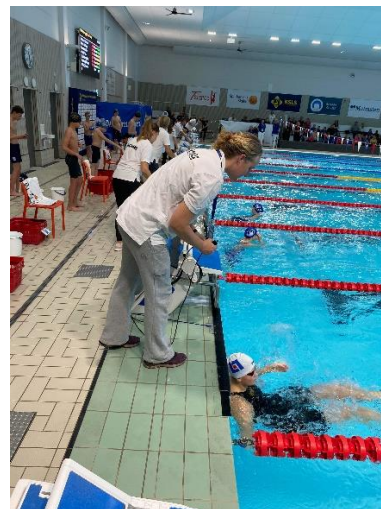
Sum Sim Region.