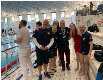
Masters-SM.