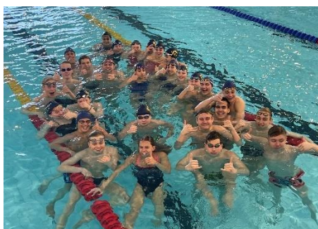
C1, 2023.

Under första helgen i december genomfördes Höstsimiaden i Karlshamn. Det var en lyckad tävling där många av de yngre grupperna deltog med många bra prestationer.