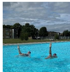
KSLS träning