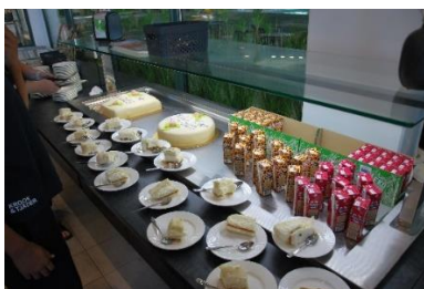
95-årsfirande vid Badriket 28 augusti 2023.

Vid våra större tävlingar under året (Vårsimiaden, Helge River Meet, Malmsten Swim Meet och SumSim Region) har flera medlemmar hjälpt till på olika sätt för att allt ska fungera väl för simmare, ledare, funktionärer och publik. Exempel på uppgifter har varit att baka, ordna och servera fika till ledare och funktionärer, försäljning av fika till publik, dörrvärd samt hjälpa gästande klubbar med diverse saker.