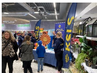
Stora Coop event.