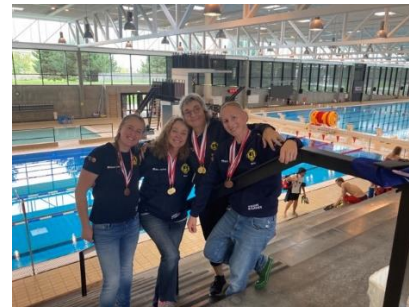
Masters Nordiska mästerskapen.