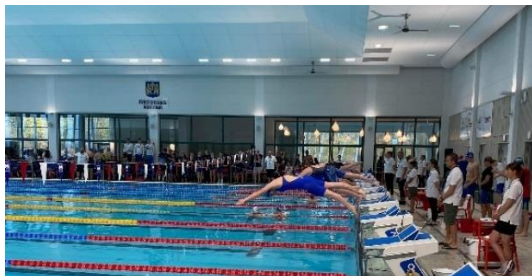
Sum Sim Region, Badriket.

Sum-Sim Region – kvaltävlingen till Sum Sim Riks: Helgen den 11–12 november anordnade KSLS tävlingen Sum-Sim Region vilket är ett mästerskap för simmare som är 13 år och äldre. Tävlingen pågick samtidigt på 7 olika platser i Sverige. Till tävlingen var 229 simmare anmälda från 15 olika klubbar, det var 1166 individuella starter och 53 lagstarter. För KSLS startade 32 simmare. Det blev en fantastisk tävling med många fina personliga rekord och flertalet simmare som hamnade bland de 16 bästa tiderna i Sverige och därmed kvalificerade sig till Sum-Sim riksfinal som gick av stapeln på Eriksdalsbadet helgen 8–10 december. Från föreningen deltog sedermera sex simmare i riksfinalen.