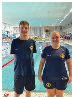
ParaSM 2023.