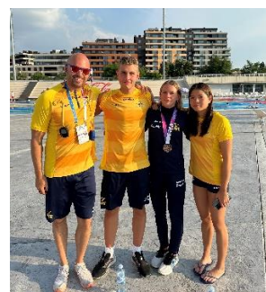
Junior EM.