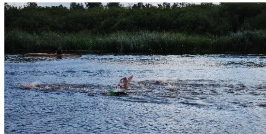
Helge River Meet augusti. Foto KSLS

För att kunna genomföra dessa tävlingar har det krävts många ideella krafter, såväl funktionärer som övriga som hjälper till med det utanför bassängen. Så med det vill än en gång rikta ett stort tack till alla funktionärer (interna och externa), tränare, simmare och föräldrar som hjälpt till så att vi kunnat genomföra tävlingar och sätta föreningen på kartan, som en positiv plats som andra klubbar vill återkomma till.