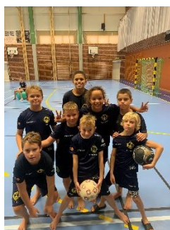
Våra yngre simmare.