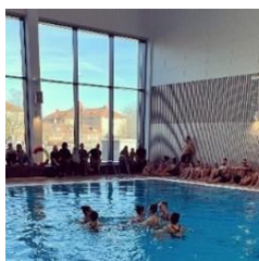
VÖSS uppvisning