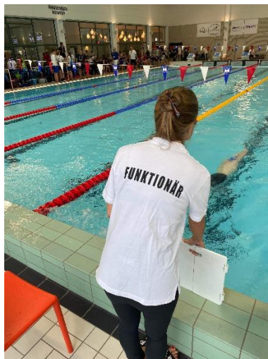
Sum Sim Region.